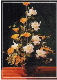
مرحوم مرتضی گلکار