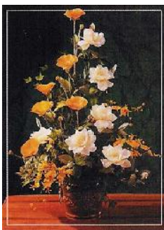
مرحومه منظر شجاع ۴۳ ساله از فسا