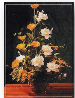
مرحومه خانم حمایل مرادی