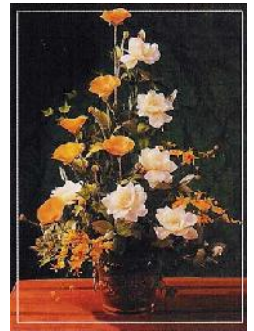
مرحوم بابا زمانی