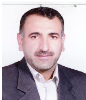
مرحوم محسن بلاغی