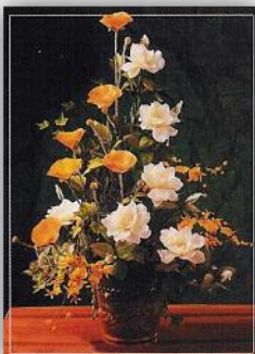
مرحوم غلامرضا جعفری